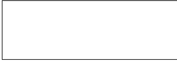
Схема границы балансовой принадлежности тепловых сетей

Прочие сведения по установлению границ раздела балансовой принадлежности тепловых сетей _____